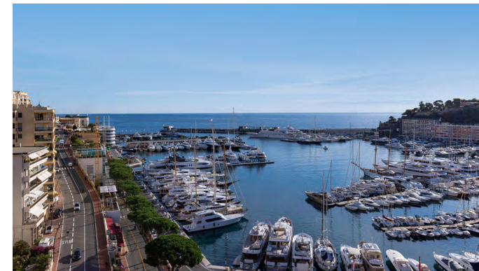
Dotta Real Estate — Monaco Port Hercule 082—089