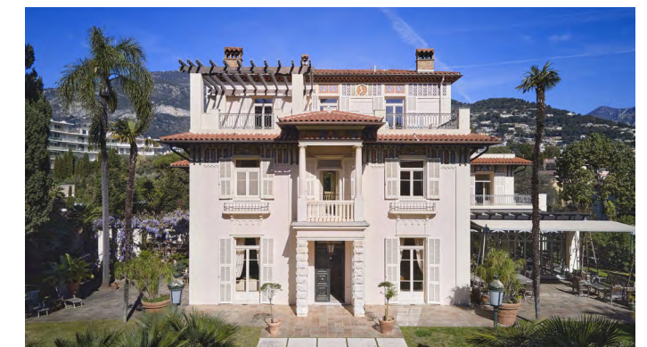
A2 Concept — 106—113 Villa Serena