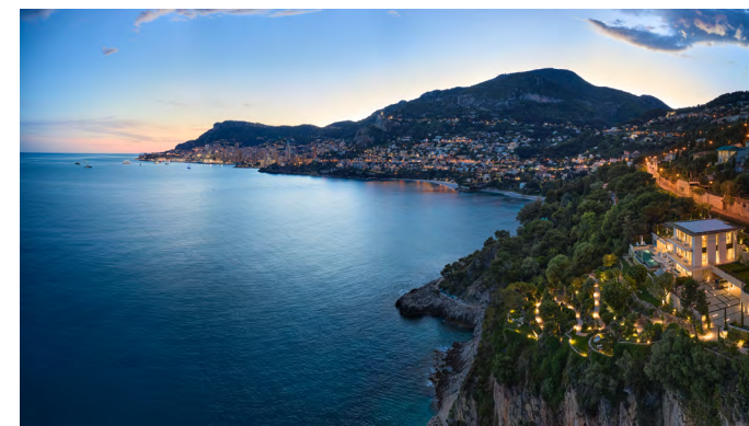
Beauchamp Estates — Un havre de paix tourné vers la mer 098—105