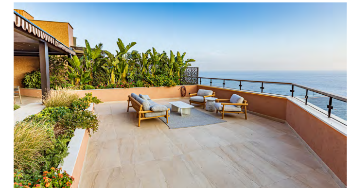
Miells Christie's — 090—097 Vue Panoramique sur la mer et la Principauté